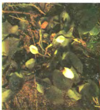
193. Образки болотні.